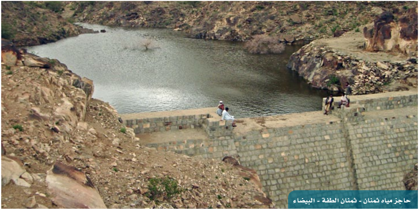
حاجز مياه ثمتان - ثمتان الطفة - البيضاء

وتجدر الإشارة إلى أن الهدف الرئيسي للمنحة هو إعادة أنظمة المياه والصرف الصحي المتضررة إلى ما كانت عليه قبل تلك المواجهات، ولهذا الغرض، تم إعداد وتوقيع اتفاقيات ثنائية بين الصدوق والسلطة