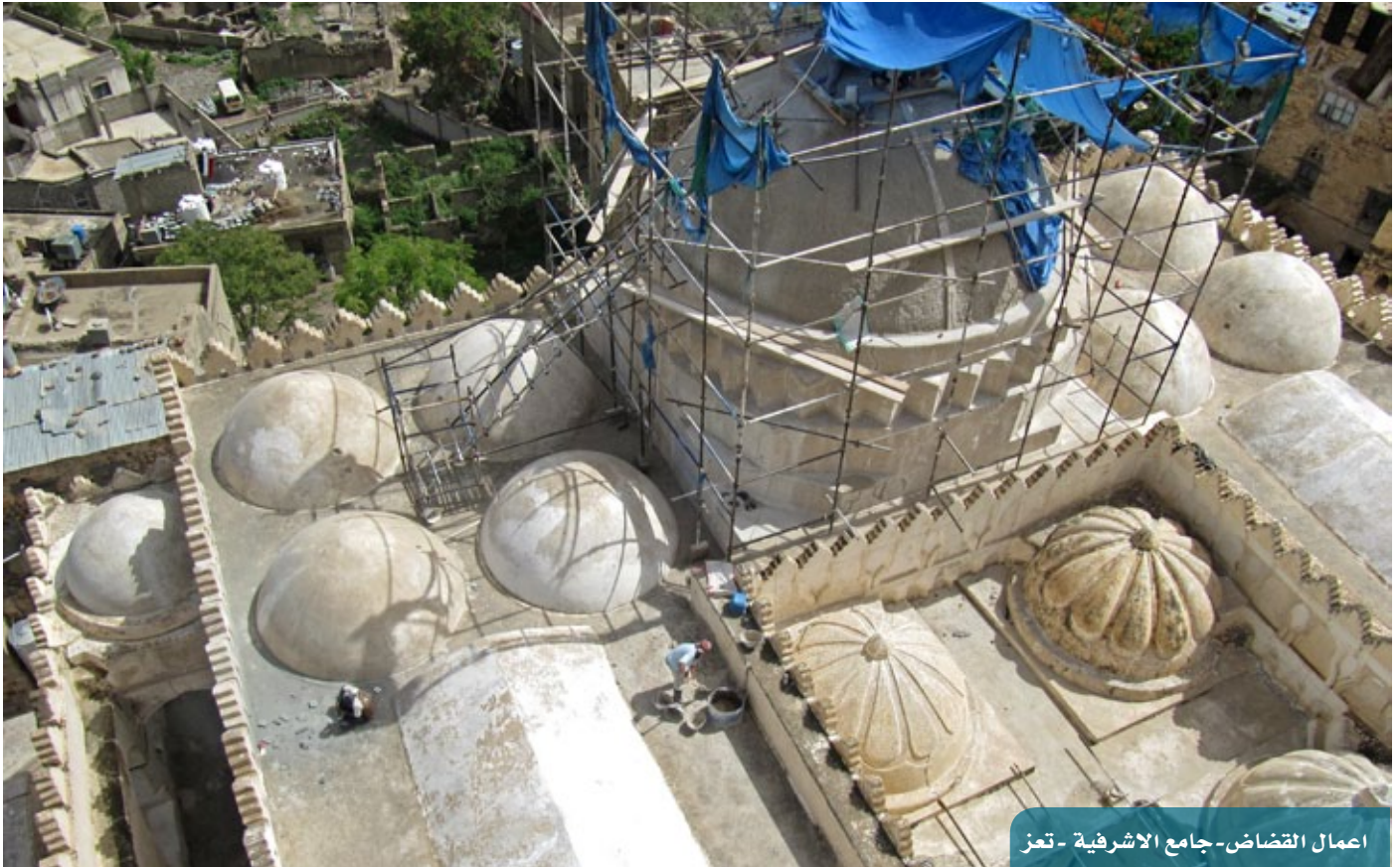
أعمال القضاض - جامع الأشرفية - تعز

تتم الانتهاء من المرحلة الخامسة من المشروع (أعمال التنفيذ المباشر بالإدارة الميدانية، وترميم الرسومات الجدارية الملونة والزخارف الجصية). وبدأ العمل في المرحلة السادسة (والأخيرة)، والتي يتم فيها الترميم الدقيق للرسومات الجدارية الملونة والزخارف الجصية والأخشاب الأثرية والأحجار بعد انتهاء دورتين تدريبيتين في مجال ترميم الأخشاب الأثرية والأحجار، وتم اختيار أفضل المتدربين للعمل في المشروع. وقد تم الانتهاء من أعمال ترميم القضاض للأرضيات والجدران والأسطح والقباب، وكذا من التنظيف الميكانيكي للنقوش والزخارف الملونة للأضرحة والبهو، وأكثر من 85 % من التنظيف