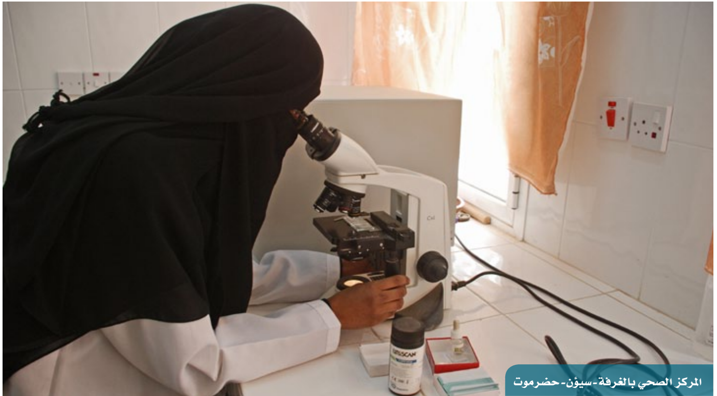
المركز الصحي بالعرفة - سيئون - حضرموت

تم توزيع ممارسات لتنفيذ مشاريع تأهيل كوادر صحية وسطية (160 طالباً/ة) في تخصص مساعد طبي، و160 طالباً/ة في تخصص فني تمريض من محافظتي ذمار والبيضاء، و45 طالباً/ة في تخصص مساعد طبي لمديرية المخا (تعز)، و40 طالباً في تخصص فني مختبرات محافظة مأرب. وتمت الترسية على معهد الوحدة للعلوم الطبية لتنفيذ مشروع تأهيل 02 طالبة في تخصص مساعد طبي من بعض مديريات محافظة حجة. والعمل جارٍ في تنفيذ مشروع لتأهيل 40 من الكوادر الصحية في تخصص تمريض (بمحافظة تعز)، و4 مشاريع لتأهيل 110 طلاب وطالبات في تخصص فني تمريض (عمران وصعدة) منهم 30 من موظفي/ات مستشفى عمران، فضلاً عن تنفيذ مشروع لتأهيل 24 طالباً كفني مختبرات (صعدة)، و20 طالبة كفنيات تمريض (شبوة).