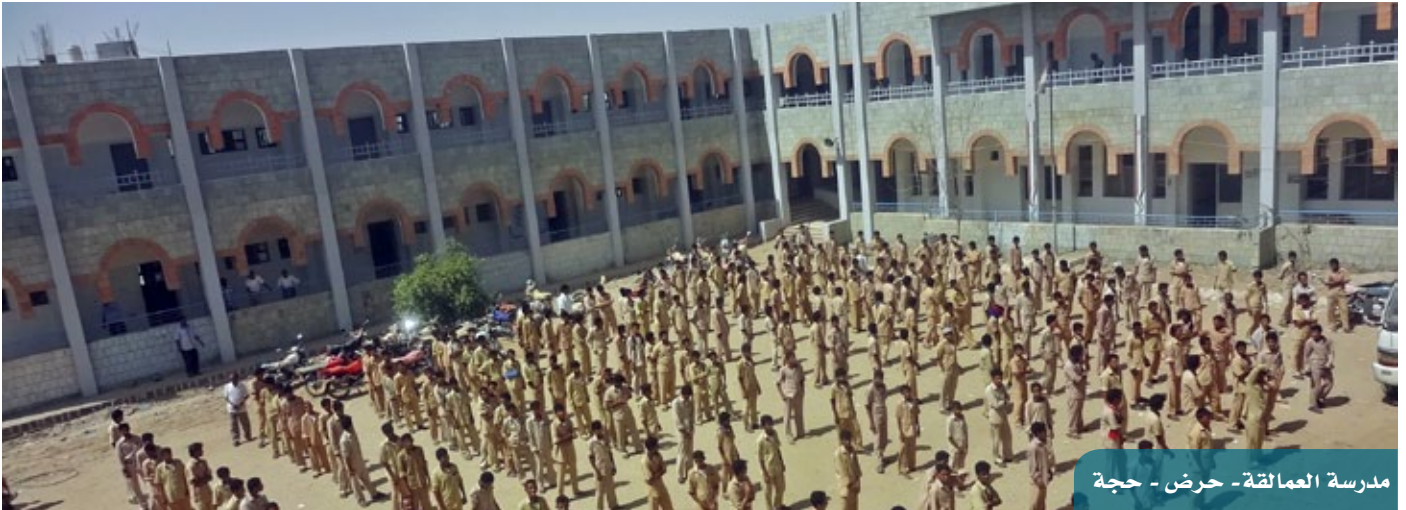
مدرسة العمالققة - حرض - حجة

كما نفذت دورتان تدريبيتان لموجهات تعليم الكبار على أساليب الاشراف والمتابعة أثناء تجريب منهاج محو الأمية الحرفية، المجموعة الأولى نفذت في مدينة المكلا لـ 12 موجهة