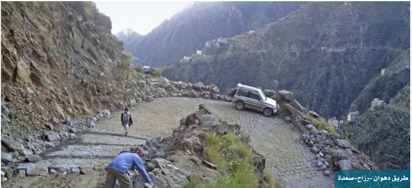
طريق دهوان -رزاح-صعدة