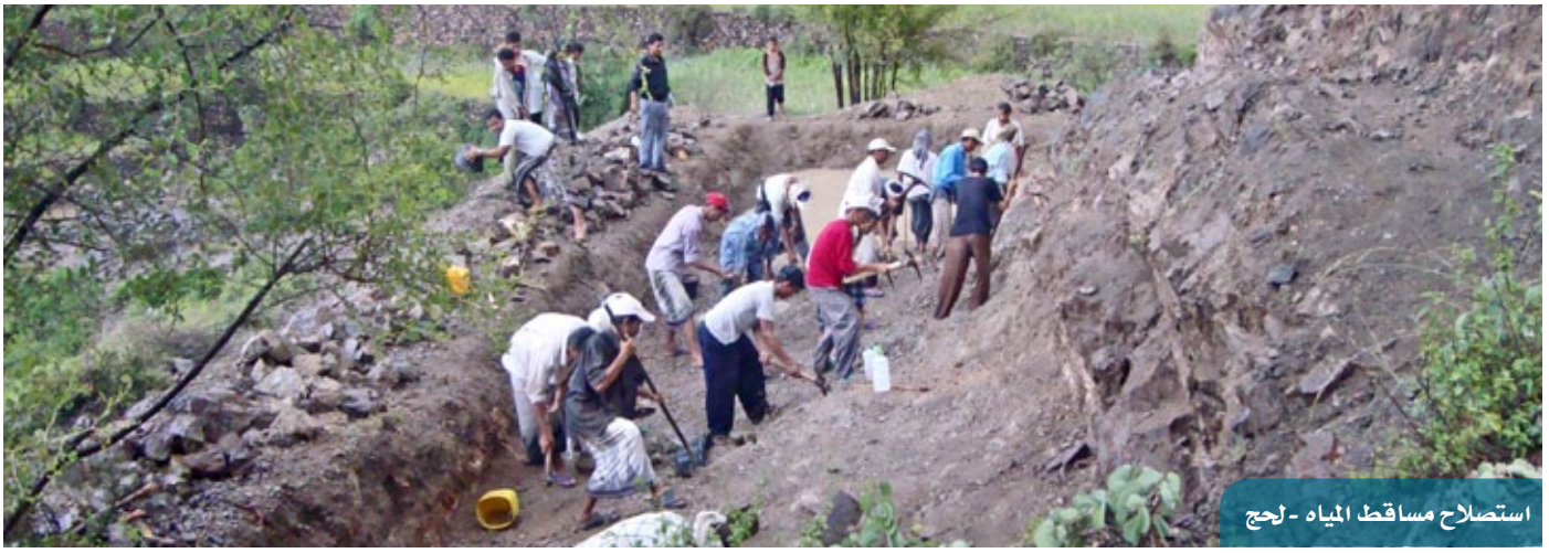
استصلاح مساقط المياه - لحج

وفي التعليم ومحو الأمية، تم توزيع 247 مصباحاً يعمل بالطاقة الشمسية للملتحقات بصنوف محو الأمية بالتنسيق مع جهاز محو الأمية في عزلة القحيفة (تعز). وضمن مشروع إعداد مدربات في مجال محو الأمية، نُفِّذَت دورتان لاثنتين وعشرين متدربة في التوعية بأهمية محو الأمية وتعليم الفتاة في فرعي حجة وذمار.. بالإضافة إلى 4 دورات لتدريب مدربين في فروع ذمار وحجة وإب